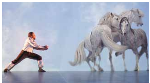
La Bossa Fataka de Rameau

Après avoir reçu à Prague en 2005, le prix de la meilleure captation d'opéra pour le film réalisé par François Roussillon, Les Paladins reçoivent le Grand Prix Audiovisuel et DVD de l'Académie Charles Cros 2006 et le diapason d'or de l'année 2006 décerné au meilleur DVD de l'année.