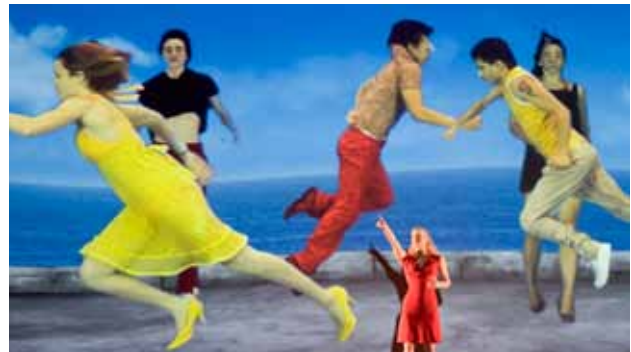
Good Morning, Mr. Gershwin

• une seconde partie, Good Morning, Mr. Gershwin , en septembre 2008 pour l'ouverture de la Biennale de la Danse de Lyon.