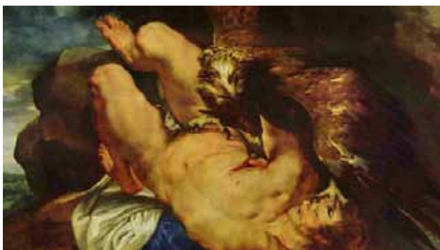
Rubens, Prométhée enchaîné , détail

C'est à la fois en tant que peintre d'un Orphée ( Orpheus vertraut die Hilfe der Unterweltsgötter , 1635), mais aussi en tant que contemporain de Monteverdi que ce peintre influencera les répétitions. De cette immersion ne resteront peut-être que quelques détails visibles par le spectateur, mais le passage par Rubens servira d'ancrage pour l'imaginaire de la compagnie comme une trame « sensorielle ». C'est en premier lieu dans le travail du mouvement que s'incarnera le thème.