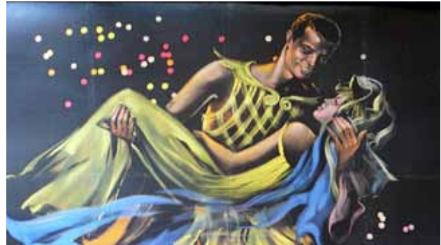
Affiche du film Orfeo Negro (Marcel Camus, 1959), détail