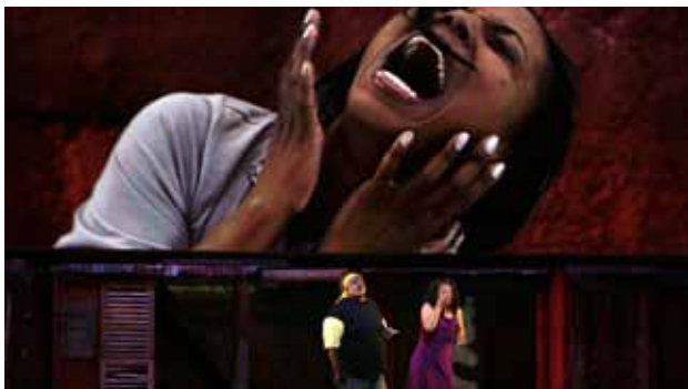
Porgy and Bess

• une première partie en mai 2008 à l'Opéra national de Lyon avec Porgy and Bess , mise en scène et chorégraphie de Montalvo-Hervieu et direction musicale de William Eddins