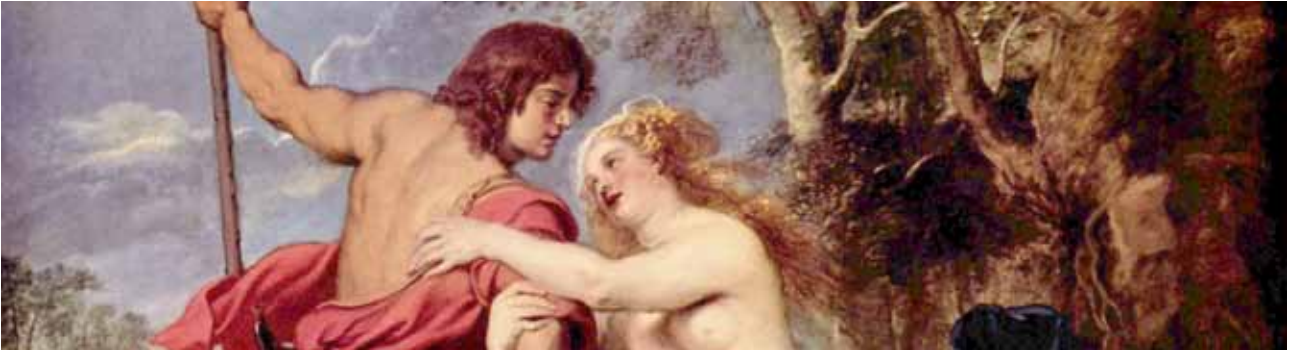
Rubens, Vénus et Adonis , détail